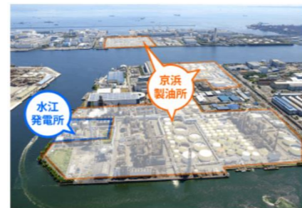
全てが川崎にあり、効率の良い立地が強み 基本的に転勤が無いのも魅力の一つです！