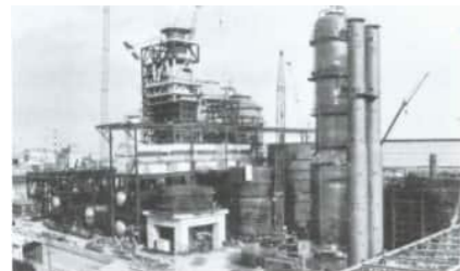
世界初、日本唯一の装置フレキシコカー 現在では工場夜景の代名詞としても有名です！

石油精製において、独自の視点とアプローチで、業界を、日本社会を牽引してきた。そして、これからも。