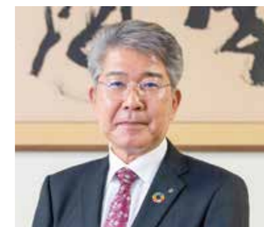
鳳工業株式会社 代表取締役 社長

ぜひ、私たち鳳工業の仲間となって、「暮らしを支える」という大きなやりがいのある仕事を通じ、感動を分かち合いましょう。