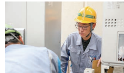
現場は商業施設や会社ビル、個人宅など多様です。どの現場もガス工事の責任者は一人。自分の仕事が鳳工業の評価に直結することに責任感と誇りを感じています。