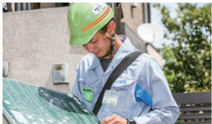
古いものなら50年前の導管もあります。予測を立てていても想定外のことも起こるため、一つひとつ問題を解決しながら工事を進めます。

震災の復興支援で2度現地に派遣されたことも、大きな転機になりました。これからは誇りを持って働き、ガス導管事業全体をとらえて仕事ができるようスキルを高め、同じ道を目指す後輩を育成していきます。