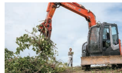
老朽化したパイプの改修やガスの供給量増加にもなう基地の増設など、工事の種類はさまざま。5人ほどの小さな班で工期は平均2か月ほど。人間関係が密なのも特徴です。

入社7年経って感じるのは、経験を積むほどに知識が増えその知識があることで予測が立てられ、スムーズに仕事ができるようになる面白さ。今後は、大規模な案件の見積もり業務に携われるようになること、1級土木施工管理技士や1級管工事施工管理技士の資格を取得し仕事の幅を拡げることでステップアップしていきます。