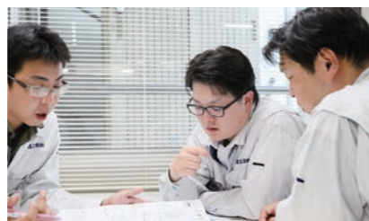
社内のガス設備の方と一緒に仕事をすると、ガス配管を勉強するチャンス。どの順番で作業すれば効率が良いのかを、実体験を通して身に付けています。