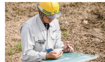
何もわからなかった1年目は、右往左往しながら片っ端から質問しました。先輩やベテラン作業員さんが嫌な顔せず親身になって教えてくれ、今の自分がいます。