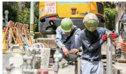
震災の復興支援で仙台と熊本に派遣され、取り換えや改修を終えたときの住民の方々の安堵した表情を見て、ライフラインを支える自分の仕事への誇りを再確認しました。