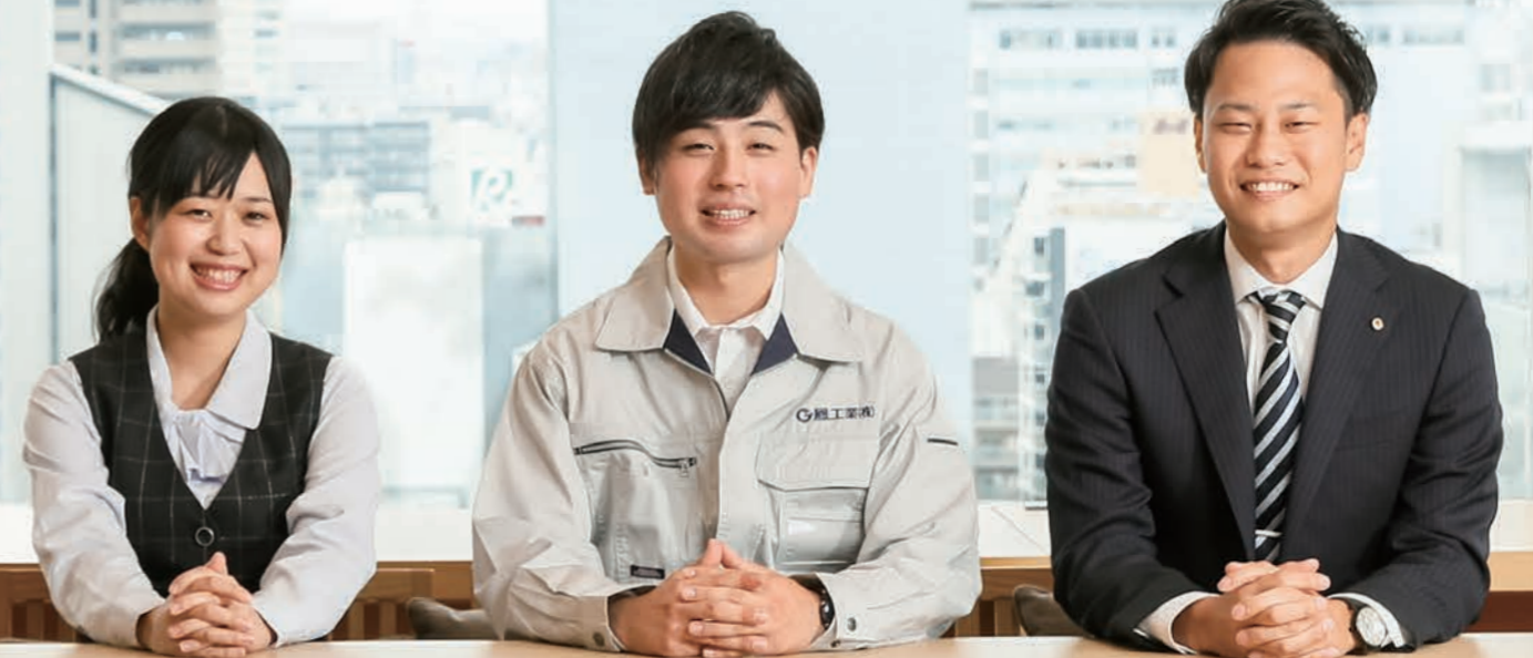
設備設計部 設計課