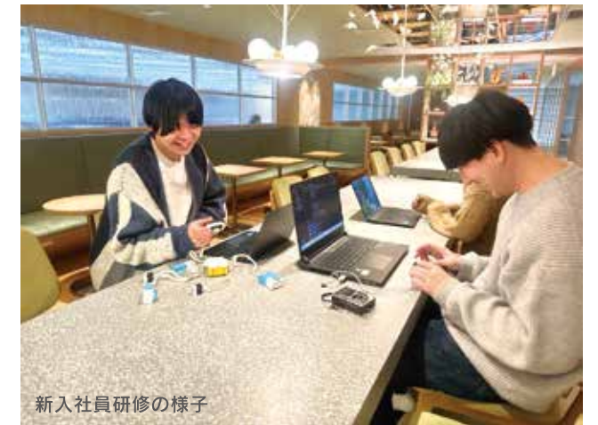
新入社員研修の様子

新入社員研修を終えた後は部署へ配属となり、先輩社員についてOJT（On-the-Job Training）で実際の業務を行いながら、技術を習得していただきます。