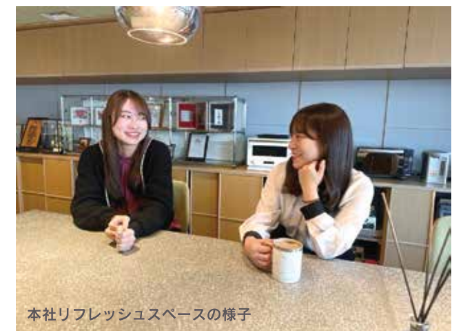
本社リフレッシュスペースの様子

また、本社、支社にはカフェコーナーがあり、コーヒーやスープ、ウォーターサーバー等を社員が無償で利用することができます。特に本社にはリフレッシュスペースと呼ばれる共有エリアがあり、社員が休憩しながら雑談する場面に遭遇することもあります。